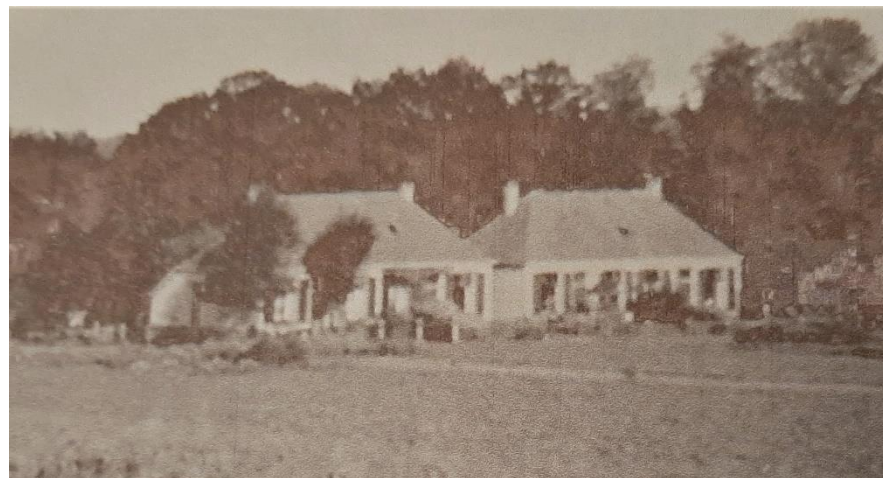
Zijn woning (de tweede of derde van de vier 'molenaarswoningen') markeerde in die jaren het eind van de bebouwing van Lochem.